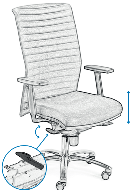
EN Seat height adjustment by means of the right lever FR Réglage de la hauteur de l'assise à l'aide d'un levier PL Regulacja wysokości siedziska za pomocą prawej dźwigni