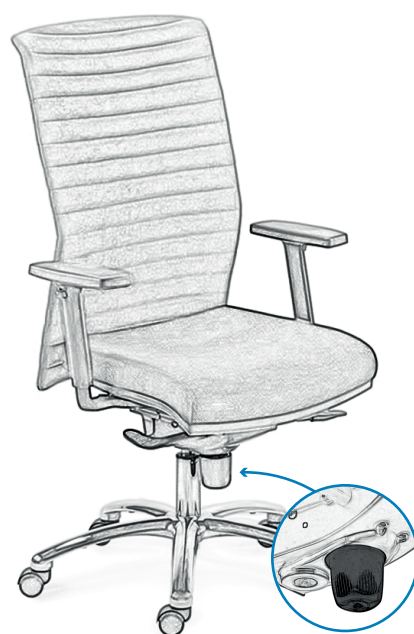
EN Adjusting the intensity with the handwheel FR Réglage de la tension à l'aide de la molette inférieure PL Regulacja napięcia za pomocą pokrętła dolnego