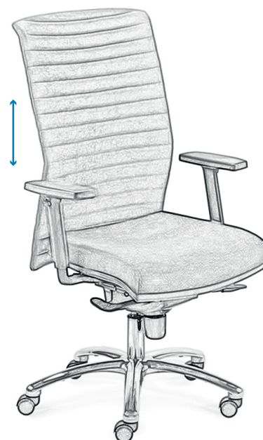
EN Backrest height adjustment FR Réglage de la hauteur du dossier PL Regulacja wysokości oparcia