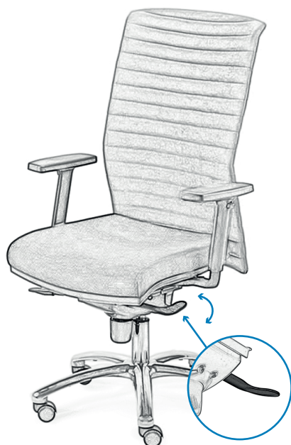
EN Synchronized adjustment of the tilt angle of the backrest and seat by means of the left lever FR Réglage synchronisé d'inclinaison du dossier et de l'assise à l'aide du levier gauche PL Zsynchronizowana regulacja kąta pochylenia oparcia i siedziska za pomocą lewej dźwigni